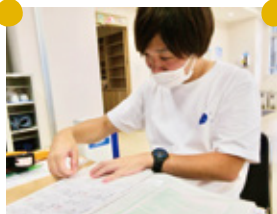
販売会ラベルはりのようす

楽しい土曜日、日曜日、祝日の過ごし方 2019年3月1日より、コインニアのみ きたで働いています。コインニアでは、厨房 での、パン作り、カフェでの、接客、そして 水耕栽培で種まきをして、育った野菜などを 収穫したりしています。平日5日間働いてい ます。色々な仕事などがあり、楽しいです。 そして、休みの日は、硬式テニス、趣味で プロ野球観戦などをして楽しんでいきます。硬 式テニスは、4年していて、最初の頃は、ポ ールに当たることが多かったです。最初は、ポ チ、ミスばかりでしたが、今では、コートや 一緒にしている仲間達とも、互角にラリーし たりして楽しんでいきます。 アロ野球観戦は以前から応援して、ファン 歴13年です。援送D。N.A.バスターズが好 きで年に6試合観に行、て応援しています。