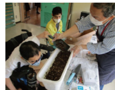
ボランティアさんと一緒に頑張りました

この原稿を書いている時点では、種から芽が出て、すくすくと育っている最中ですが、本号が発行された頃、岡本ホームの庭には、百花繚乱、色とりどりの花が咲き誇り、その美しさが私たちを楽しませてくれていることでしょう。