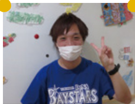
お気に入りのバスターズTシャツのさっせい