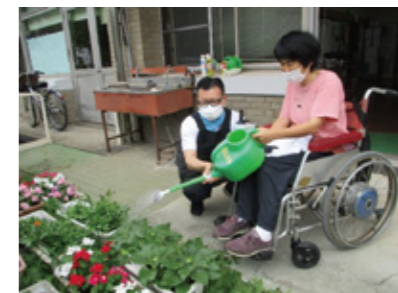
きれいな花が咲きますように