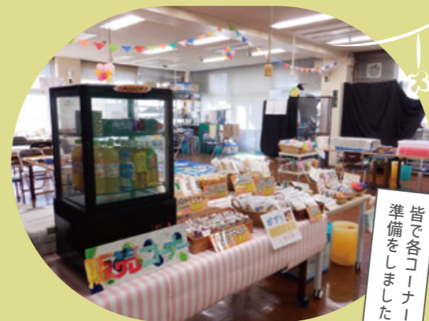
皆で各コーナーの 準備をしました!

来年以降、更に活気のある施設公開行事を実施したいと考えています。今後とも、皆様のご協力よろしくお願い致します。