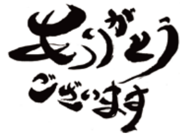
イラスト(文):高橋 進

泉会感謝録(23年7月~23年9月、順不同・誤字等失礼がありましたら、ご連絡ください)