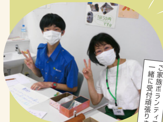
ご家族ボランティアさんと 一緒に受付頑張りました!