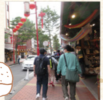
日帰り旅行で中華街へ 2022年