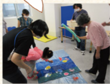
利用者交流イベント 2020年