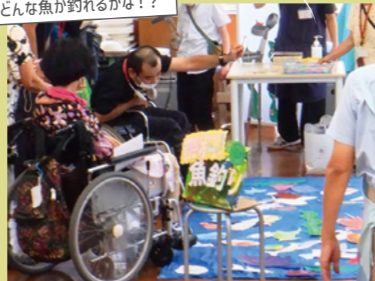
どんな魚が釣れるかな!?