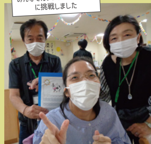
みんなでカレンダー作り体験 に挑戦しました