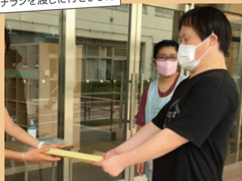
チラシを渡しに行きました