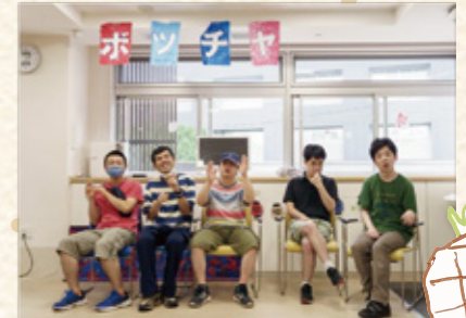
コイノニアまつり 2023年