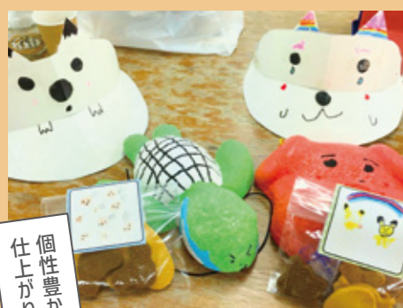
個性豊かな作品に 仕上がりました