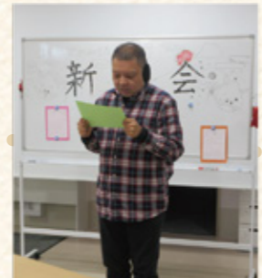
初めての新年会 2019年