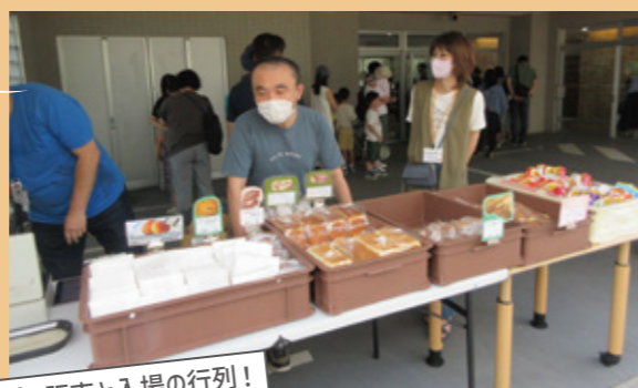
パン販売と入場の行列!

一般のお客様をお招きして開催するのは4年ぶりとなった施設公開行事のコイノニアまつり。約150名の方にご来場いただき、近隣の方に施設の活動を知っていただく良い機会となりました。今回はパン作り体験、ステンシル体験、綿あめ作り、ポッチャの4つのレクをご用意して皆さんに楽しんでいただけるように利用者も準備の段階から頑張りました。沢山のボランティアさんのご協力もあり、大盛況のコイノニアまつりとなりました。